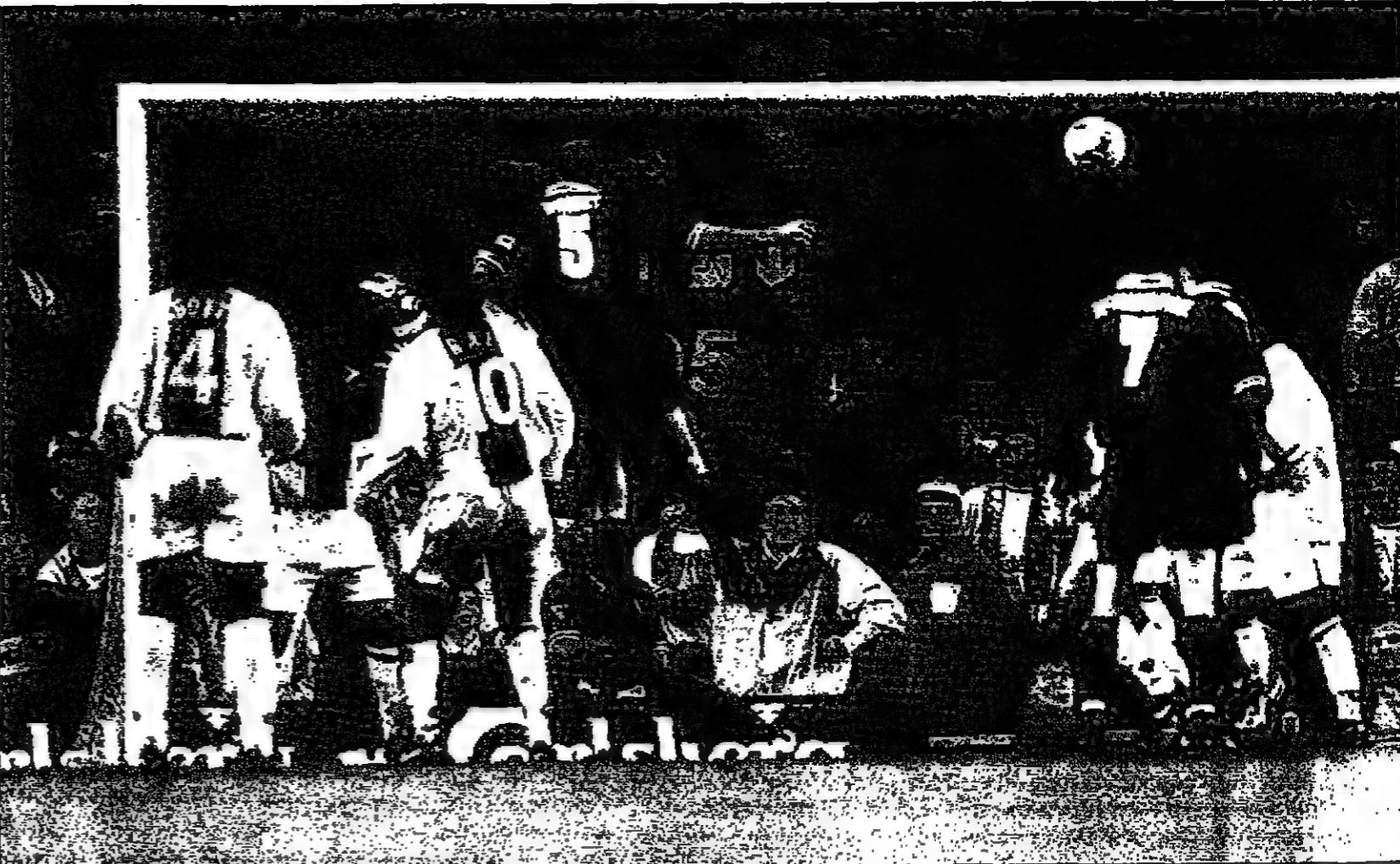
مركز تيم نديم ليربول يقفل أسددا هدفا في مرعى سان جيرمان